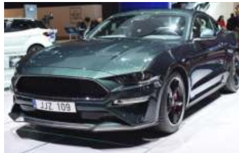
Ford Mustang 2018