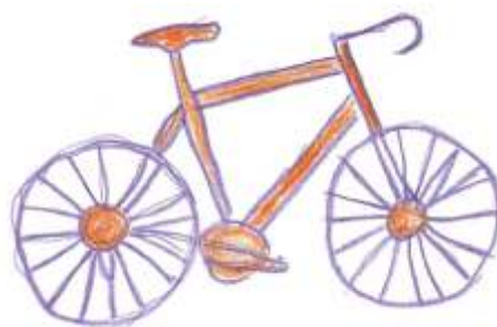
Rys. Dawid Szweda