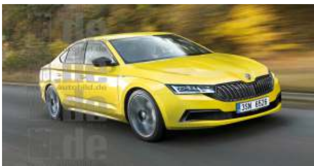
Skoda Octavia 2019

(W artykule wykorzystano materiały z Internetu).