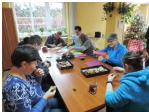
Rys. Marta Żurek