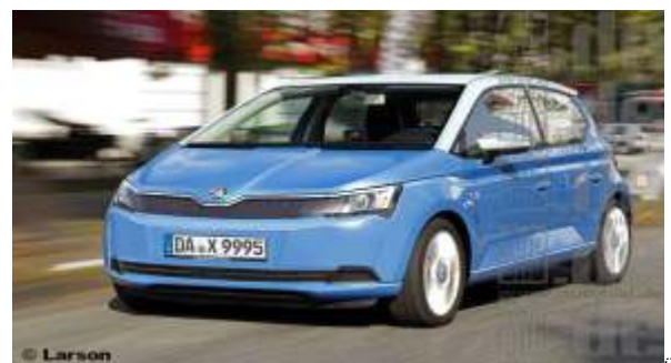
Skoda Citigo 2