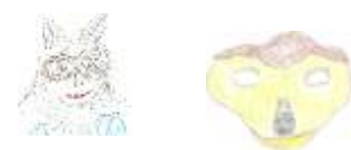
Rys: M. Żurek