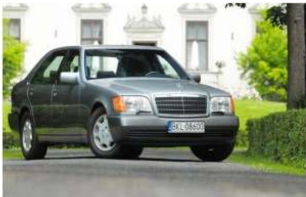
Mercedes klasy S model W140

Witam ponownie w kąciuku SAMOCHODY W PIGUŁCE. Przyszła pora opisać kolejny z moich ulubionych samochodów czyli Mercedesa klasy S model W140. Zapraszam do lektury.