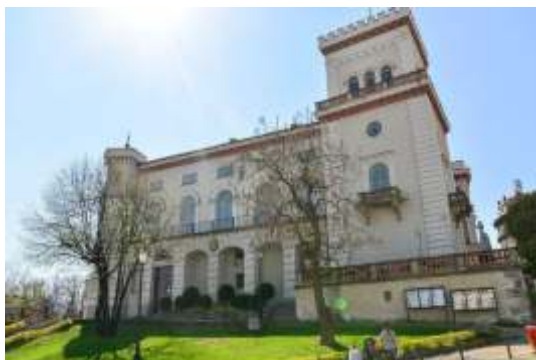
Zamek Sułkowskich w Bielsku-Białej