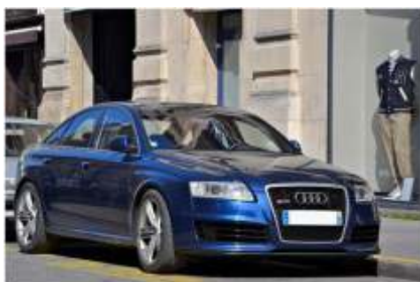
Audi RS6 C6 sedan

Audi RS6 C6 - zostało zaprezentowane we wrześniu 2007 roku. Na początku 2010 roku, quattro GmbH pokazało model kończący produkcję RS6 C6 - RS6 Plus, w limitowanej ilości - 500 sztuk. Auto poza dodatkowymi pakietami wyposażenia, miało również przesuniętą blokadę prędkości do 303 km/h. Każdy model oznaczony jest tabliczką znamionową z numerem. Dostępne wersje nadwozia: kombi i sedan. W lipcu 2010 roku quattro GmbH zakończyło produkcję modelu RS6 Plus C6.