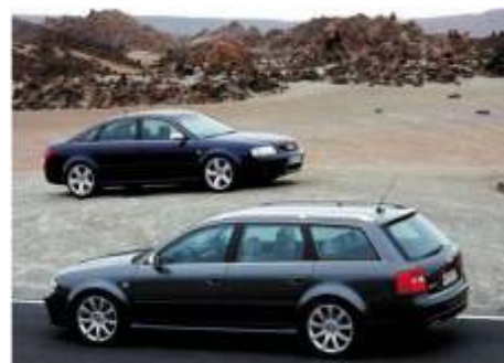
Audi RS6 C5

Audi RS6 - usportowiona odmiana Audi A6 powstała na bazie czterech generacji: C5, C6, C7 i C8. Audi RS6 C5 - zadebiutowało w czerwcu 2002 roku. Samochód skorzystał z płyty podłogowej C5 koncernu Volkswagen AG. Do napędu użyto silnika V8 o pojemności 4.2 litra. Wyposażony był on w rozrząd typu DOHC oraz układ 5 zaworów na cylinder. Wspomagany był przez układ bi - turbo. Dzięki temu generował on moc 450 koni mechanicznych (331 kW) przy 5700 - 6400 obr./min. Moc przenoszona była na obie osie poprzez 5 - biegową automatyczną skrzynię biegów typu Tiptronic.