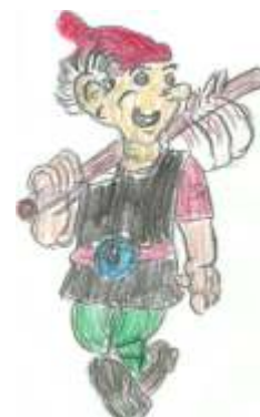
Rys: M. Żurek