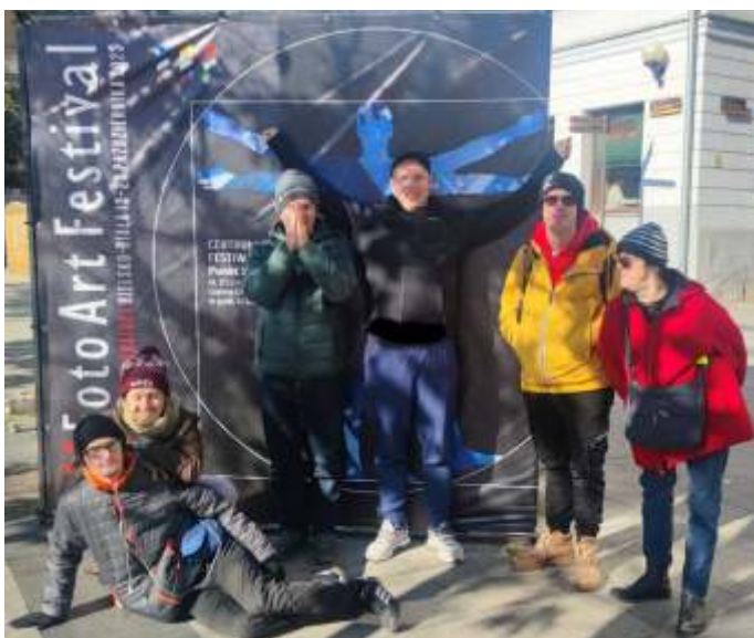
Foto Art Festival

W dniu 12.12.2023 w pracowni malarskiej odbył się konkurs plastyczny na najładniejszą choinkę. Uczestnicy pracowali z dużym zaangażowaniem wykorzystując dowolne techniki i własną kreatywność. Efekty pracy tak zachwyciły komisję konkursową, że postanowiła przyznać 5 pierwszych miejsc. Wspaniale Kochani! /red./